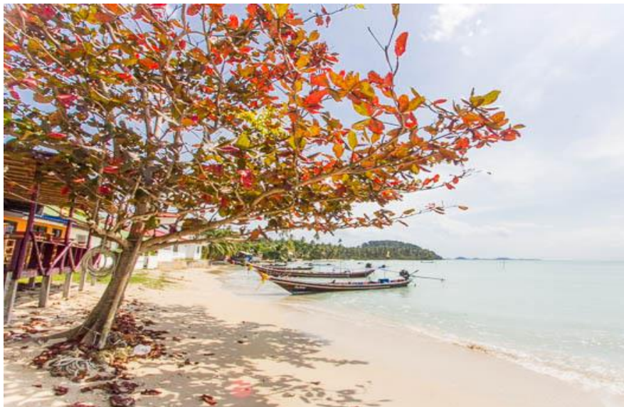
อ่าวท้องกรูด