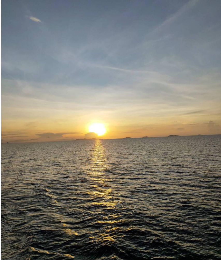
พระอาทิตย์ตกดินที่ อ่าวตลิ่งงาม

ในบรรดาชายฝั่งตะวันตกของเกาะสมุย หาดตลิ่งงามจัดว่าเป็นหาดที่สวยงามที่สุดและมีความเป็นส่วนตัวมากที่สุด จึงไม่ใช่เรื่องแปลกอะไรที่จะเห็นโรงแรมระดับห้าดาวเลือกที่นี่เป็นที่ตั้ง หมู่บ้านตลิ่งงามไม่ค่อยเจริญเท่าใดนัก ค่อนข้างเงียบสงบและมีบังกะโล่ที่พักอยู่ไม่กี่แห่ง ที่นี่เป็นจุดชมพระอาทิตย์ตกดินที่สวยงามที่สุดของเกาะเช่นกัน