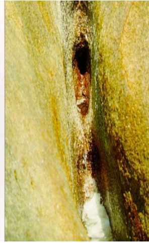
หินตา หินยาย