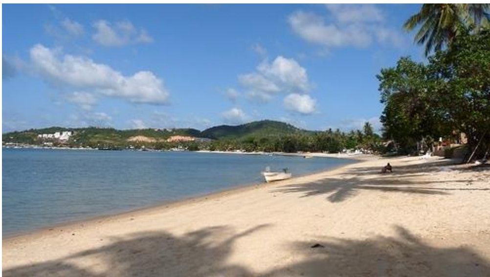
หาดบางรักซ์

นักท่องเที่ยวส่วนใหญ่มักเรียกหาดนี้กันติดปากว่า หาดพระใหญ่ หรือ BIG BUDDHA BEACH เพราะอยู่บริเวณเดียวกับพระพุทธรูปใหญ่อันเป็นศาสนสถานที่สำคัญของเกาะสมุยซึ่งตั้งอยู่บนเกาะฟาน ชายหาดที่นี่เงียบสงบมากเช่นเดียวกับน้ำทะเลซึ่งก็เหมาะสำหรับเล่นน้ำ และพักผ่อนโดยเฉพาะผู้ที่มาเป็นครอบครัวและคู่รักที่ต้องการความเป็นส่วนตัว แต่ยังคงต้องการความคึกคักอยู่บ้าง มีที่พัก ร้านอาหารและร้านค้าอยู่หลายแห่งแต่ไม่มากนัก