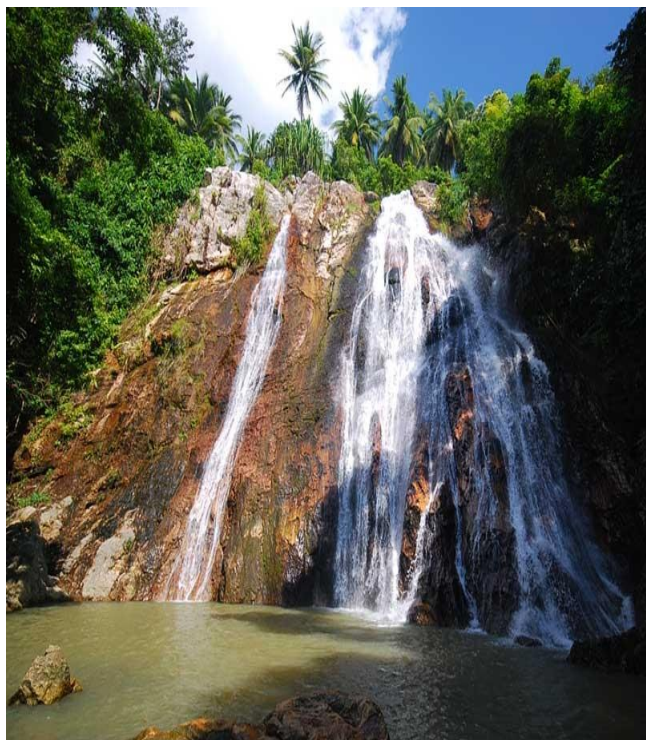
น้ำตกหน้าเมือง ๑

มีต้นกำเนิดจากภูเขาใหญ่ใจกลางเกาะไหลผ่านเทือกเขาไหลลงสู่พื้นที่ราบ ลักษณะเป็นน้ำตกจากหน้าผาสูง ชั้นประมาณ ๓๐-๔๐ เมตร ความกว้างของหน้าผาประมาณ ๒๐ เมตร กรมป่าไม้จัดให้เป็นวนอุทยาน น้ำตกหน้าเมืองมีเนื้อที่ประมาณ ๑๐ ไร่ น้ำตกแห่งนี้ รัชกาลที่ ๕ เคยเสด็จประพาสและรัชกาลที่ ๙ เคยประทับเสวยพระกระยาหารกลางวัน เมื่อวันที่ ๒๔ เมษายน ๒๕๐๕