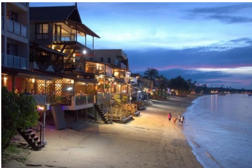
หาดบ่อผุด

ที่ตั้งและการเดินทาง อยู่บริเวณชายฝั่งด้านเหนือของเกาะไม่ไกลจากหาดบางรักซ์