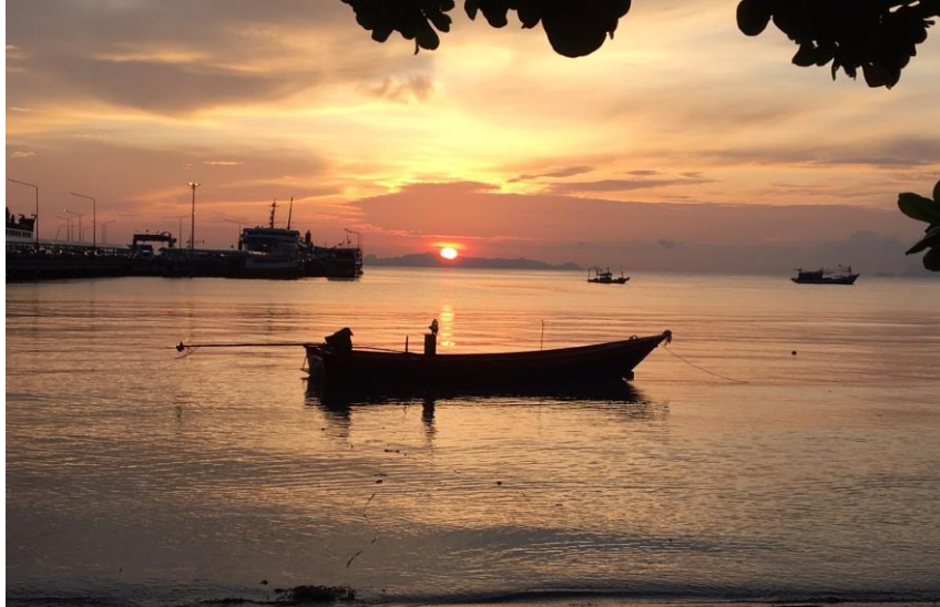
พระอาทิตย์ตกดินที่ อ่าวหน้าทอน

หน้าทอนเป็นเสมือนหน้าบ้าน ของเกาะสมุยเพราะมีท่าเทียบเรือรับ-ส่งนักท่องเที่ยวอันเป็นจุดสิ้นสุดการเดินทางทั้งภายในเกาะและการเดินทางต่อไปยังเกาะต่างๆใกล้เคียงไม่ว่าจะเป็น เกาะพะงัน วนอุทยานแห่งชาติหมู่เกาะอ่างทอง เกาะเต่า และเกาะนางยวน บริเวณท่าเทียบเรือหน้าทอนจะคึกคักเป็นพิเศษ โดยเฉพาะช่วงฤดูท่องเที่ยวเช่นเดียวกับท่าเทียบเรือขนส่งสินค้าและอาหารทะเลที่อยู่ไม่ไกลนักก็คึกคักไม่แพ้กันเลยทีเดียว หน้าทอนจึงเป็นสวนรวมของทุกสิ่งทั้งหน่วยงานราชการและรัฐวิสาหกิจต่างๆ ตลอดจนบริษัทเอกชน ธนาคาร ร้านค้าและตลาด