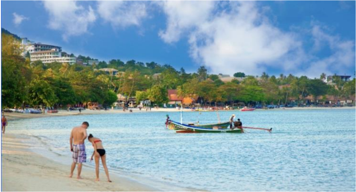
อ่าวเชิงมน

ที่ตั้งและการเดินทาง อยู่ทางเหนือของเกาะใกล้หาดบางรักซ์ ห่างจากหาดแฉวงประมาณ ๔ กิโลเมตรและห่างจากหน้าทอนราว ๒๕ กิโลเมตร