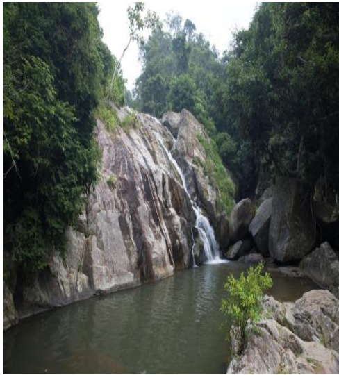
น้ำตกหินลาด