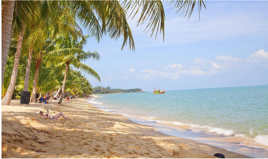
หาดแม่ น้ำ

สำหรับผู้ที่ต้องการสัมผัสสันยามค่าคืนเพื่อเปลี่ยนบรรยากาศจะต้องขับรถไปที่อื่นทางฝั่ง ตะวันออกของเกาะ