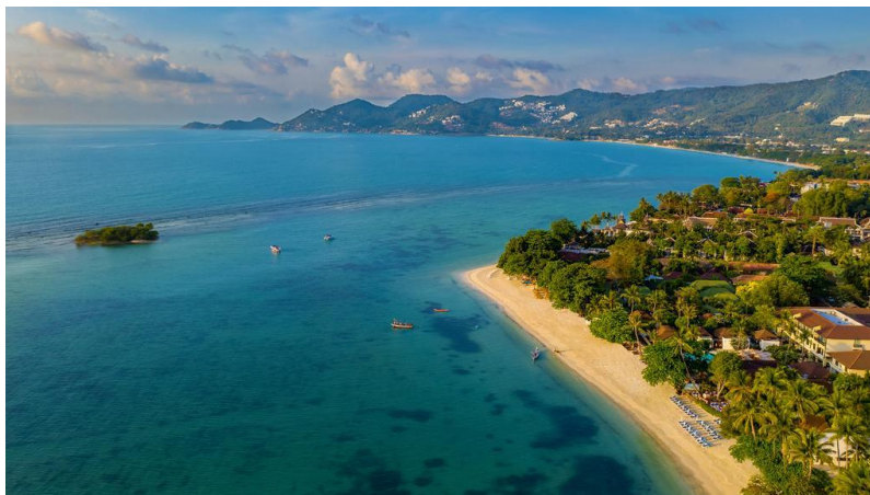
หาดนาเทียน

แนวปะการังและความเงียบสงบเป็นจุดเด่นของที่นี่ เหมาะสำหรับผู้ที่ต้องการความเป็นส่วนตัวและชอบดำน้ำด้วยสนอร์เกิ้ล มีรีสอร์ตอยู่หลายแห่ง