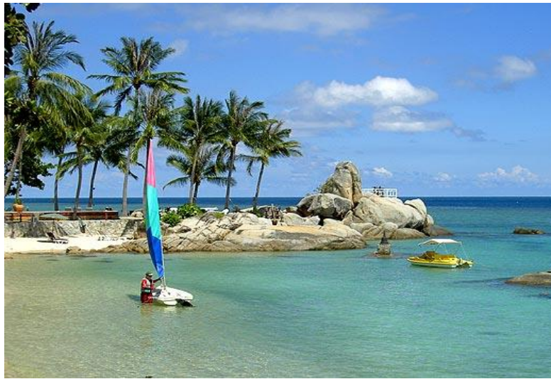
อ่าวแหลมเสด็จ