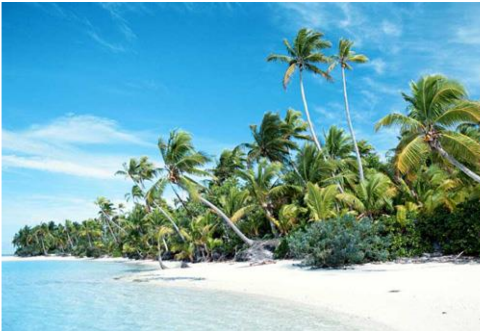
หาดบางปอ

น้ำทะเลที่ค่อนข้างสงบและแนวปะการังที่มีอยู่เกือบตลอดแนวของหาดทำให้ที่นี่เหมาะแก่การ ดำน้ำด้วยสนอร์เกิ้ลอย่างยิ่ง บริเวณหาดบางปอมีบังกาโลนาพักหลายแห่งด้วยกัน