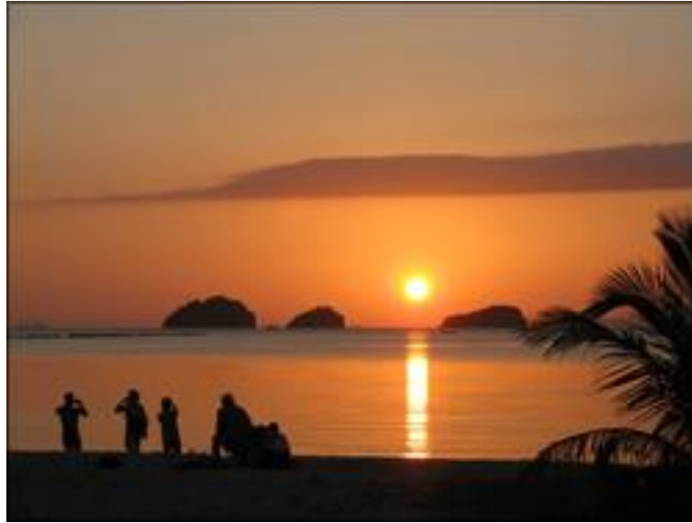
อ่าวพังกา

ชายหาดบริเวณอ่าวพังกา แม้จะไม่เหมาะแก่การเล่นน้ำ เนื่องจากเป็นหาดเลนและน้ำตื้นมาก แต่การได้ดื่มด่ำกับบรรยากาศนามอาทิตย์ลับขอบฟ้าที่นี่จะช่วยให้วันพักผ่อนบนเกาะสมุยสมบูรณ์แบบยิ่งขั้น บริเวณอ่าวพังกา เป็นจุดชมพระอาทิตย์ตกที่สวยงามบนเกาะ โดยเฉพาะช่วงหน้าร้อนในวันที่ท้องฟ้าแจ่มใส จะมองเห็นพระอาทิตย์ตกได้ชัดเจนและสวยงามมาก นอกจากนี้เรือประมงของชาวบ้านพังกาที่จอดเรียงรายอยู่นั้นช่วยเสริมบรรยากาศได้อย่างยอดเยี่ยม มีบังกาคาโลที่เจียบสงบนำพักอยู่ ๓-๔ แห่ง