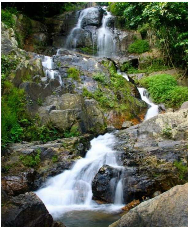
น้ำตกหน้าเมือง ๒